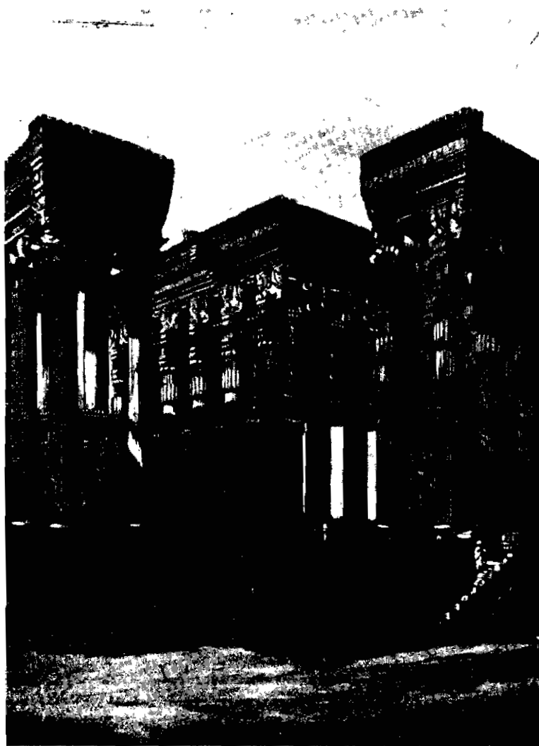
طالار قصر خشایارشا در پرسپولیس (تخت جمشید) در فارس در وقت آبادی از روی نقشه شیبیز

Hall of Audience of Xerxes at Persepolis (Restoration by Chipiez).