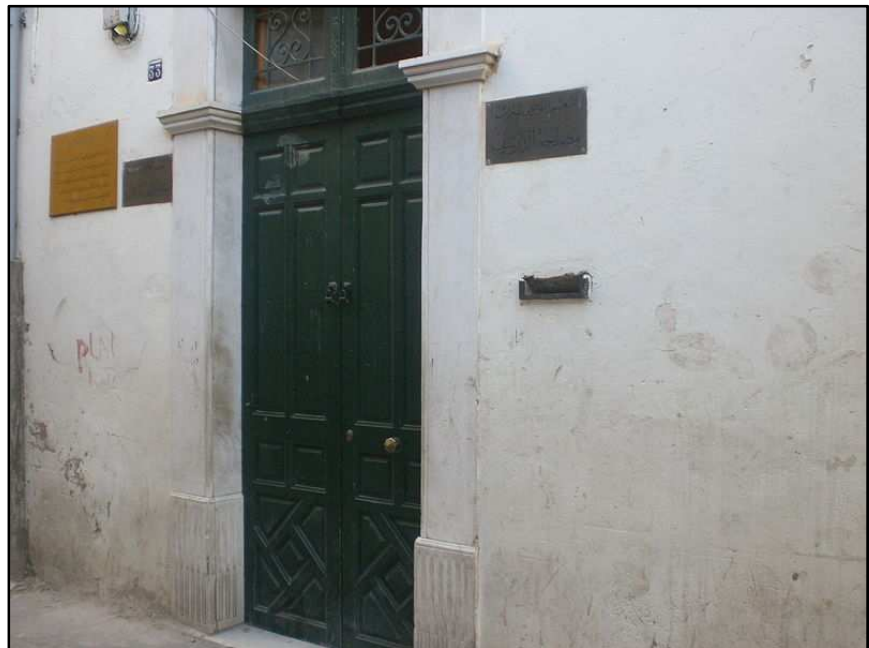
خانه ابن خلدون در تونس