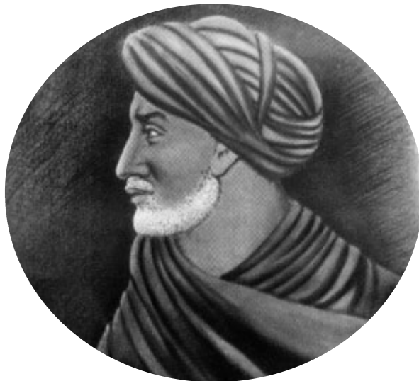
تصویری خیالی از ابن خلدون