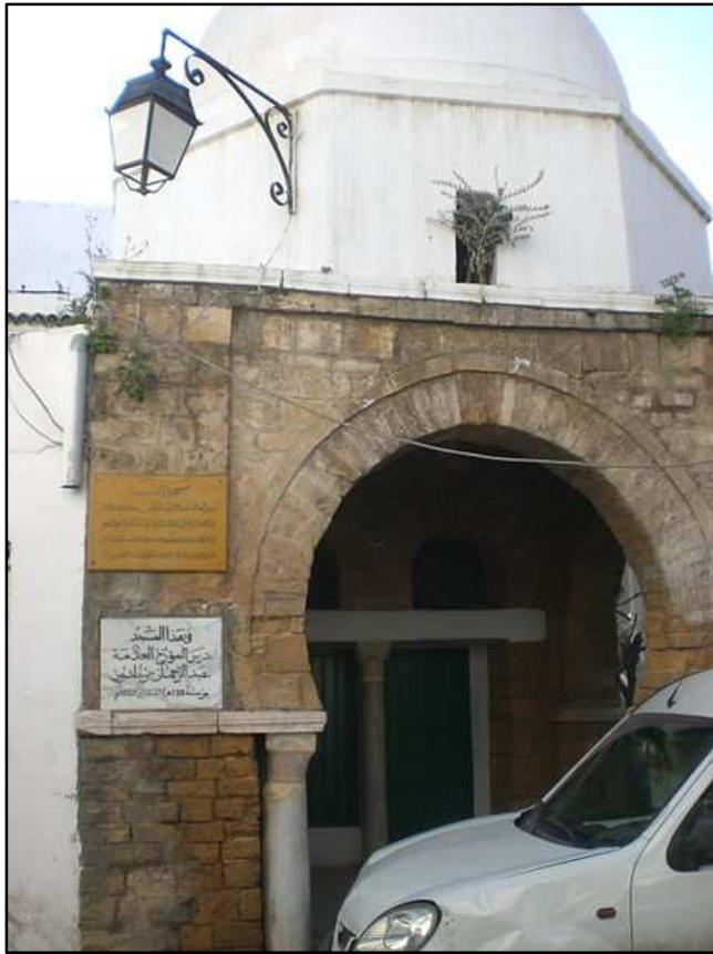
مسجدی که ابن خلدون در آنجا درس خوانده است. (تونس)