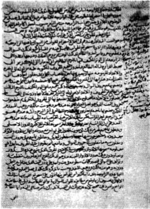
صفحه ای از نسخه خطی ینی جامع که در حاشیه آن خط مؤلف آمده است.