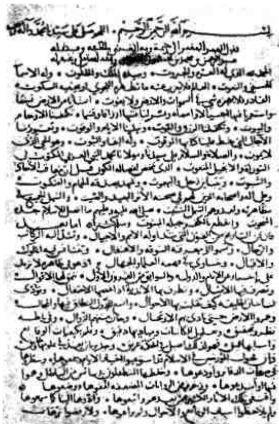
صفحه اول نسخه خطی یینی جامع که این ترجمه با نسخه مزبور مقابله شده است.