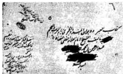
پشت جلد نسخه خطی یینی جامع